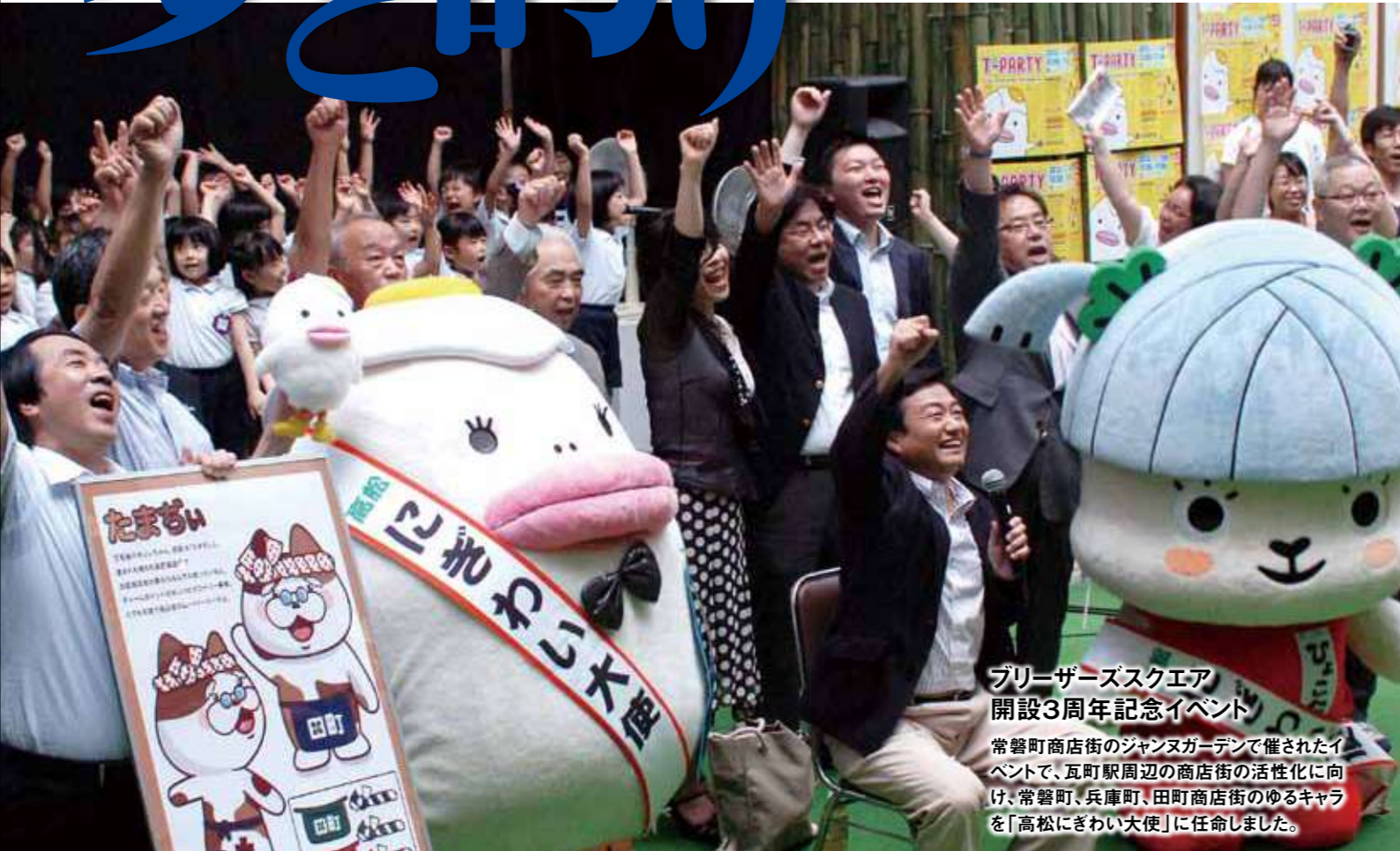
ブリーザーズスクエア 開設3周年記念イベント 常磐町商店街のジャンヌガーデンで催されたイベントで、瓦町駅周辺の商店街の活性化に向け、常磐町、兵庫町、田町商店街のゆるキャラを「高松にぎわい大使」に任命しました。